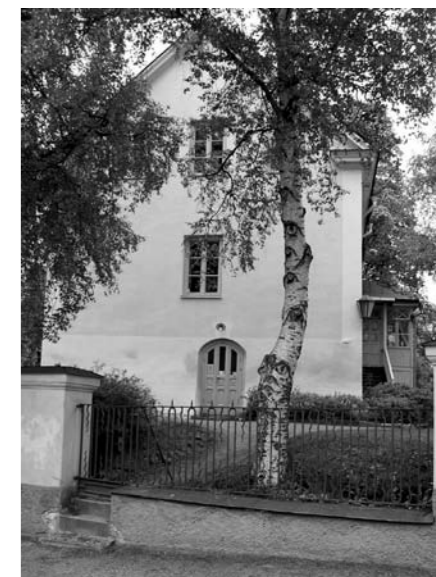
Föreningen Fängelsemuseet i Gävle